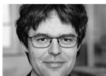
Dr. Stefan Spycher Leiter des Schweizerischen Gesundheitsobservatoriums (Obsan), Bundesamt für Statistik (BFS), Neuenburg

Die heutige Informations- und Wissensgesellschaft verlangt von den Bürgerinnen und Bürgern immer mehr Kompetenzen. Eine davon ist die Gesundheitskompetenz. Dieser Begriff, der im englischsprachigen Raum als «Health Literacy» schon seit einigen Jahren diskutiert wird, fasst im deutschsprachigen Raum erst allmählich Fuss. Gesundheitskompetenz ist die Fähigkeit jedes und jeder Einzelnen, im täglichen Leben Entscheidungen zu treffen, die sich positiv auf die Gesundheit auswirken (vgl. Kasten 1 ). Nutbeam (2000) unterscheidet drei Ebenen der Gesundheitskompetenz: