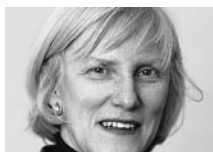
Dr. med. Therese Stutz Steiger Leiterin Sektion Neue Themen, Bundesamt für Gesundheit (BAG), Liebefeld b. Bern

Ähnlich wie Lesen und Schreiben für die Bewältigung des beruflichen und gesellschaftlichen Alltags notwendig sind, braucht es Gesundheitskompetenz, um gesund zu werden, gesund zu bleiben und gesundheitspolitische Entscheide zu fällen. Ausländische Studien lassen vermuten, dass es auch in der Schweiz vielfach an Gesundheitskompetenz fehlt. Zudem haben die Anforderungen, um sich im Gesundheitssystem zurechtzufinden, in den letzten Jahren stark zugenommen. Fehlende Gesundheitskompetenz wirkt sich jedoch nicht nur im Gesundheitswesen selbst, sondern auch in Wirtschaft, Gesellschaft und Politik aus.